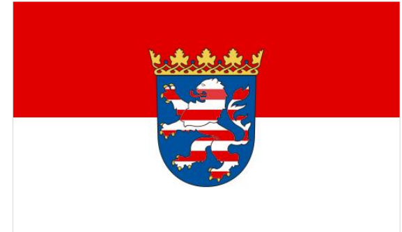
IHRE BETREUUNG IN HESSEN